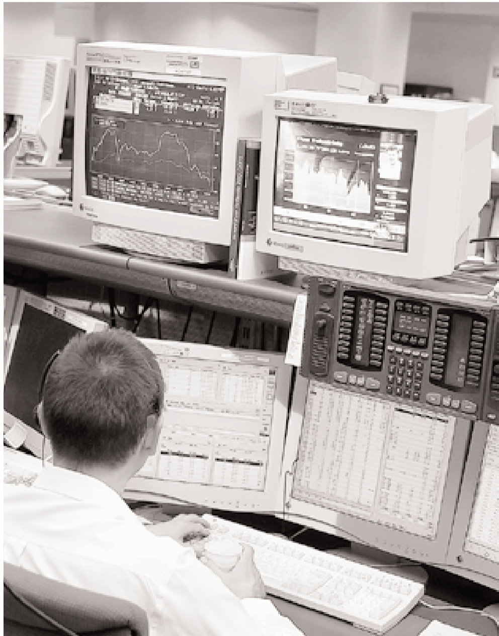
Das Kapital ist besonders mobil, weshalb viele Staaten die Kapitalsteuersätze senken. KEY

Der Druck des Steuerwettrennens wird zuweilen auch übertrieben, wie Laszlo Kovacs andeutet, EU-Kommissar für Steuern und Zollunion: «Eine hohe Steuerbelastung schreckt nicht unbedingt die Investoren ab.» Kovacs verweist auf die skandinavischen Länder, die relativ hohe Steuerbelastungen hätten, in den internationalen Ranglisten der Wettbewerbsfähigkeit aber regelmässig vorne dabei seien. Die Botschaft des EU-Kommissars: Entschien-